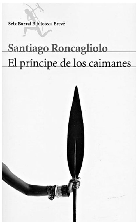
"El príncipe de los caimanes" Santiago Roncagliolo Seix Barral / 18,50 euros

Una vieja temática, en fin, vista bajo el prisma de una dureza que parece no tener fin y en la que el autor no cesa. Novela, además, bien documentada en los diversos terrenos que el novelista aborda y cuyo conocimiento a fondo, en el pasado y en el presente, no es nada fácil. Tarda un poco la narración (en la que Miguel y Tomás son las figuras mejor perfiladas) en adquirir impulso, en fijarse ante el lector con la necesaria tensión, nivel al que se llega en alto grado en las secuencias protagonizadas por Miguel y Tomás; las otras, las de Sebastián, son algo más tópicas y pueden rastrearse en varias novelas precedentes de similar asunto.